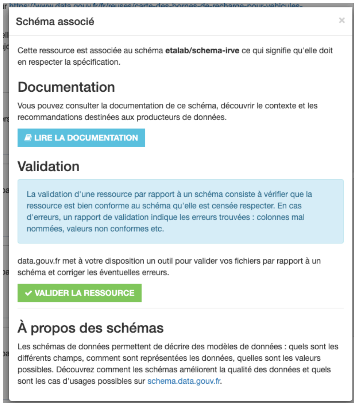
FIG. 3 : Capture d'écran de data.gouv.fr des informations disponibles sur la page d'un jeu de données lorsqu'un schéma est spécifié sur une ressource

fications de la qualité des données et d'indiquer aux réutilisateurs que vos données respectent un référentiel.